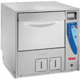
LAVA 50 DRS